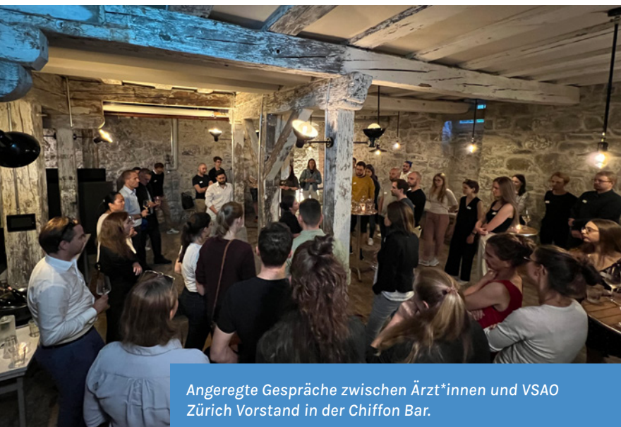
Angeregte Gespräche zwischen Ärzt*innen und VSAO Zürich Vorstand in der Chiffon Bar.

Anfang April fand die Fortsetzung der 2021 lancierten VSAO Zürich Afterwork Eventreihe statt. Der Anlass war gut besucht und die anwesenden Assistenz- und Oberärzt*innen konnten sich in lockerer Atmosphäre und musikalischer Begleitung in der Chiffon Bar austauschen und mit den anwesenden Personen aus dem VSAO