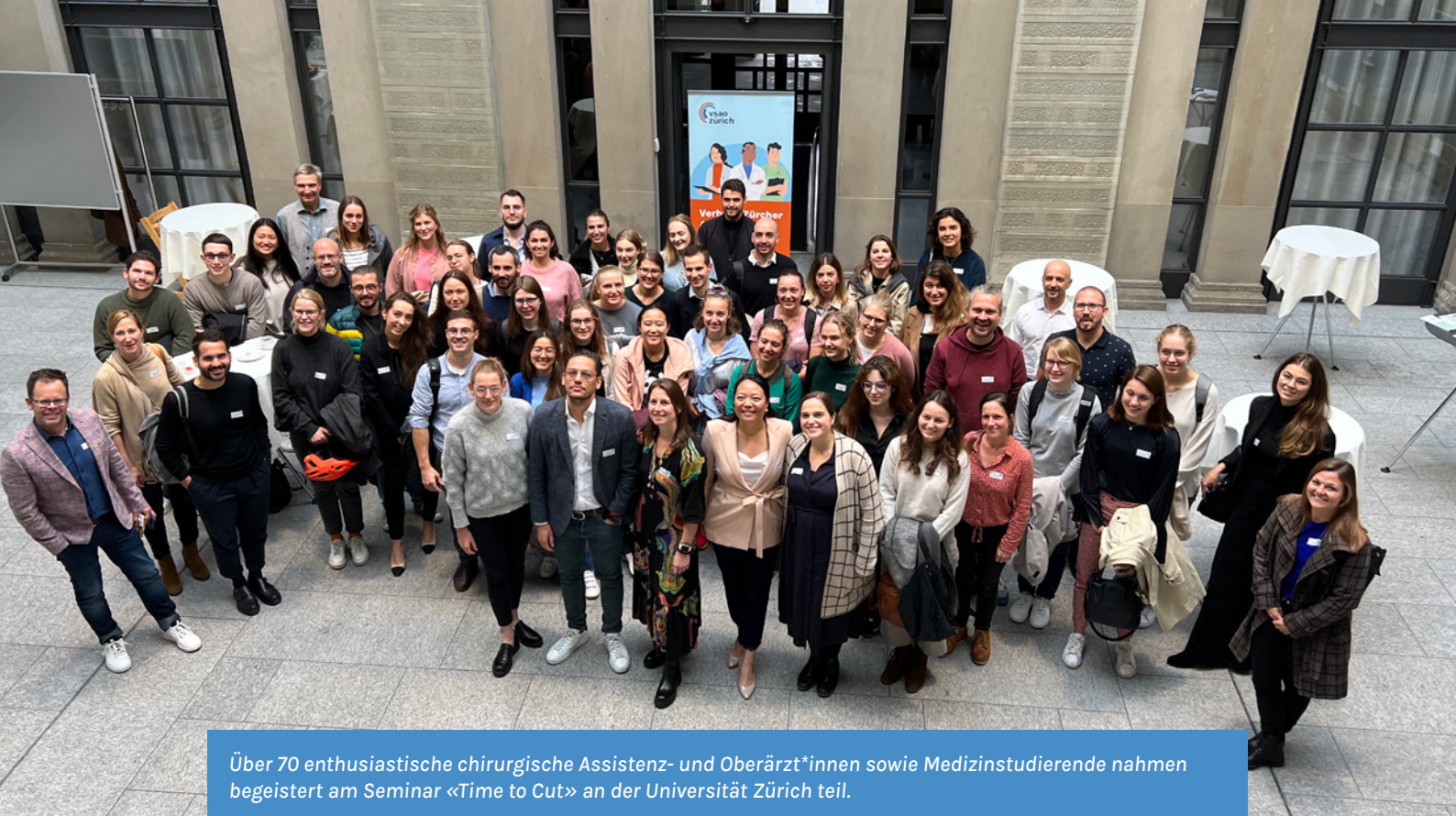
Über 70 enthusiastische chirurgische Assistenz- und Oberärzt*innen sowie Medizinstudierende nahmen begeistert am Seminar «Time to Cut» an der Universität Zürich teil.

Neben dem persönlichen Austausch und Networking wurden den Teilnehmenden viele praktische Tipps für die Gestaltung der beruflichen Karriere als Ärztinnen und Ärzte mit auf den Weg gegeben und persönliche Erfolgsrezepte ausgetauscht. Das erfolgreiche Format soll auch 2023 wieder durchgeführt werden.